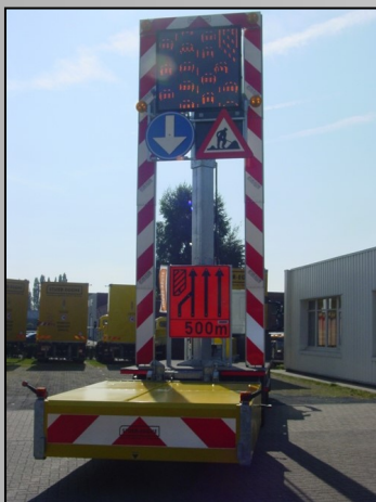
Variabel berichtenbord op telescoop